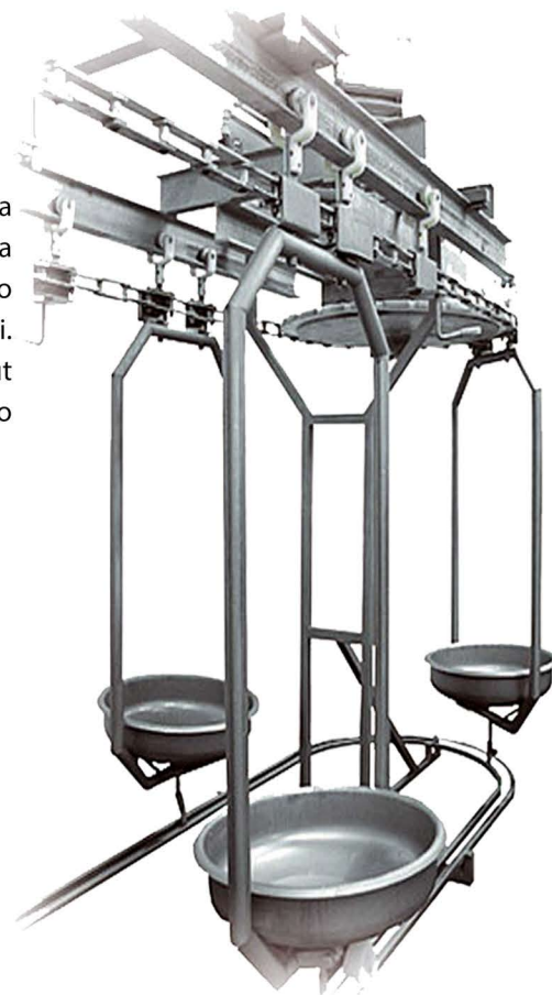
Plate-hook conveyor for intestines (plate) and offals (hook) transport from evisceration point to veterinary inspection zone. After examination intestines are transported to the entrails section, organs - after rehooking to the trolleys - to special cold room. After plate has been transported to the chute, it overturns and discharges intestines. Offals are unloading by special slide to the trough or on a table.